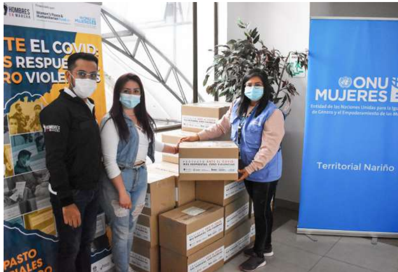
Entrega de paquetes de asistencia humanitaria en Pasto.

La ayuda humanitaria es una forma de apoyo solidario o cooperación, que es destinada a poblaciones que han sido afectadas por situaciones de crisis humanitaria, como las provocadas por la pandemia COVID-19 a nivel socio económico. En el marco del proyecto ANTE EL COVID-19: Más respuestas, cero violencias liderado por ONU Mujeres y el Fondo para la Mujer, la Paz y la Acción Humanitaria, se han entregado más de 800 kits a líderes y lideresas de los municipios Pasto, Ipiales y Tumaco con el fin de fortalecer sus activos familiares y promover la continuidad de sus incidencias comunitarias.